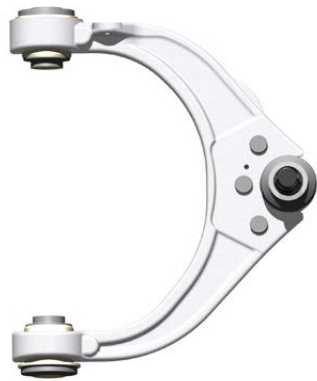
Núm. MEYLE: 316 050 0034/HD Núm. corto: MCA0461HD