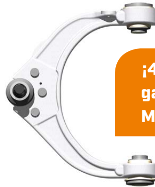
Núm. MEYLE: 316 050 0033/HD Núm. corto: MCA0460HD